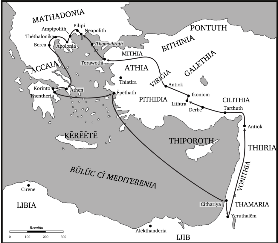
Hēroni cī ēēn ramma cī Paulo (15:35-18:22)