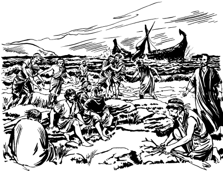
Udulie kovowolĭ cobbi kĕngĕrĕ (27:39-44)

kĭ wec vĕlĕk wo, omothinu balna őrřōt kithii cĭ adaku gimma kūdūt. 34 Kalayyung thĕk atarit daainit cĭ dĭcĭ. Nyatarka avĭ rŭgĕtĭ cunung daainta. Īdĭmanit ketee, kĭi katĭ kithii eeti cĭ enyekci rŭgĕtĭ cĭnnĕ tō.” 35 Ma balna ngĭ uduwa nĕ thōōth coo wo, ĭdĭma ahat cĭ avaadiay ĩmma, ĭthōng ethek Nyekuc ne, ibalallĕ kĕbĕrĕnĭy ĭcĭgĭk vĕlĕk. Ngaatĭ ĕngĕrĭ ahat cĭ avaadiay ĭthōng uduk nĕ ĩmma. 36 Ma natĕ, ivitia okomit ĭnōōgō vĕlĕk thinneti ĭthōng uduktoĭ. 37 Eĕn balna eeta vĕlĕk kovowolatō eet ōmmōtō kĭ eet iyyio