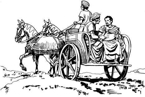
Urumtoy Pilipo kī gaalinit cī Ithiopia (8:31)

Ayak woccia katī nē dōōlī kuu, katī ngī agammīay rūgētī cīnnē?”