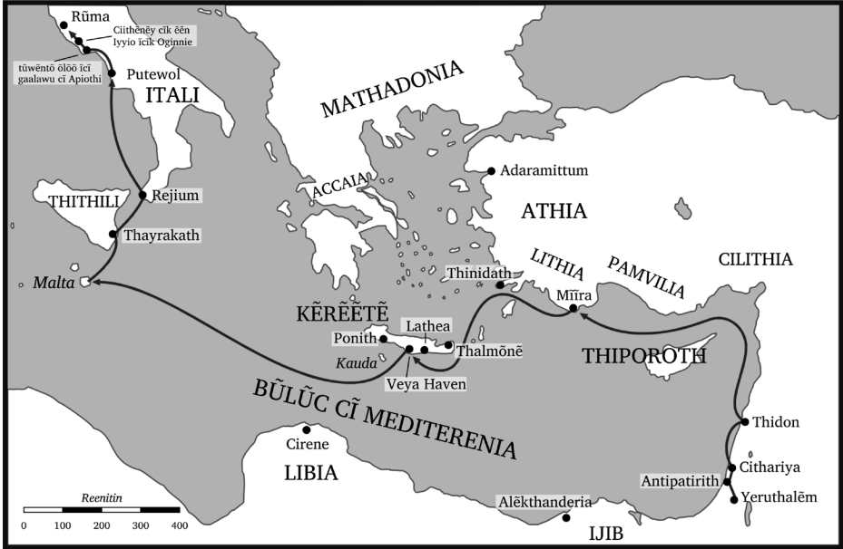
Hēroni cī ōkōyyī Paulo Rūma (27:1-28:16)

cī athī Julioth. Ēēn balna Julliathī makayyioit cī agam nyīcēkēr ōōgī cīk alaan cobbi cī Rūma. 2 Ma natē, kotoddia kovowol cī balna aku ōlōō ĩcī gaalawu cī athī Adaramittum koottia vatīkēy ĩcīk balna abīlnī kōvōwōlēta gōōla cī anū titim cī looc cī Athia, ngaatī kedeciecia ĩcī bŭlŭcō. Avī balna eeti ĩmma cī athī Arithtarkath cī balna aku looca cī Makedonia ōlōō ĩcī gaalawu ĩcī Thēthalonika.