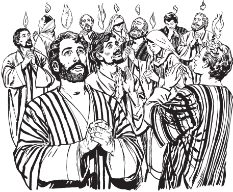
Agammit wobjiaha Ririwac cĭ dĭhĭmĭ (2:1-5)

loociowĕy ĭcĭk rĕĕng thōōth cĭnac cĭ ōthōōth eeta neekie wo nyia? 9 Keegin nōōnō naaga gwuak eet cĭk looc cĭ Parthia, ĭthōng avvu gwuak looca cĭ Media kĭ cĭk avvu Ēlama, ĭthōng ĭtō eeta gwuak cĭk looc cĭ Methopotamia kĭ Yudea kĭ Kapadocia. ĭthōng avvu gwuak looca cĭ Pontuthi kĭ Athia, 10 Virigia kĭ Pamvilia kĭ Ijib kĭ looca cĭ Libia ngatĭ ōjōōn kĭ Cirene kĭ Rūma, 11 eet cĭk Kĕrĕētĕ kĭ cĭk Arabia. Karittiyay balna naaga eeta gwuak keegin Yudei, ĭthōng balna eberyiyay eeta