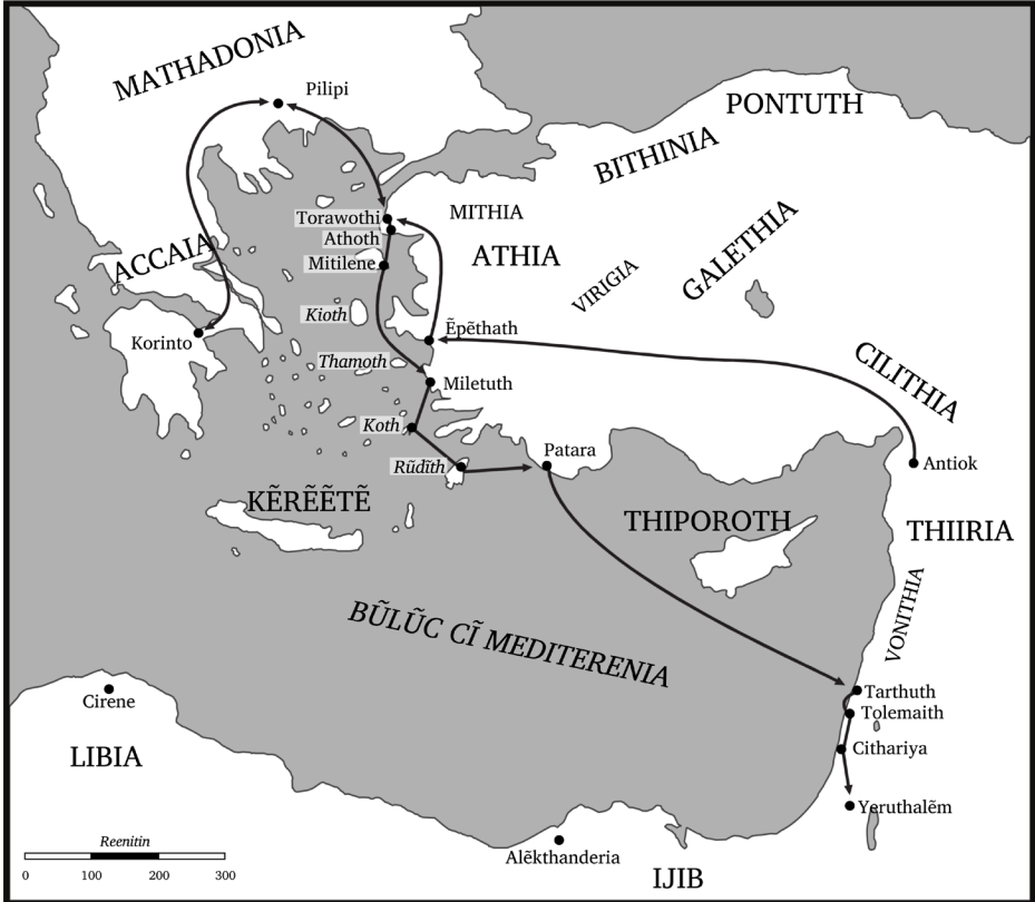
Hĕroni cĭ ĕĕn iyyio cĭ Paulo (18:23-21:17)

cĭ Ēpĕthath cĭ balna ũngnicĕ Paulo Akwila kĭ Pirithila. Ma natĕ, ũŭk nĕ Ciitha cĭ Lawinto ĭthōng othoothioy kĭ Yudei. 20 Ma balna ngĭ ajin nĕĕgĕ ĭnōnō kaavu nōnō kūrŭmtĕ kĭ ĭnōgō wathinniok ōgĭ, abŭri balna kĕnnĕ nĕ. 21 Ma balna ngĭ ĭtĭnga nĕ ũŭk, uduwak ĭnōgō ethek ne, “Mĭ ĕlĕmahia Nyekuci, kōbōda katĭna.” Ngaatĭ agamĭ Paulo kovowol Ēpĕthatha ĭthōng ũŭwa.